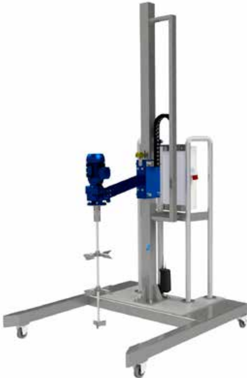
Taşınabilir Karıştırma İstasyonu