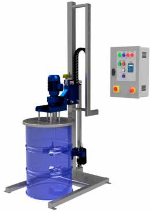
Varil Karıştırma İstasyonu